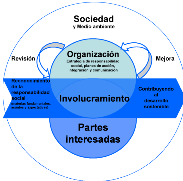
Figura 4 — Integración de la responsabilidad social en toda la organización