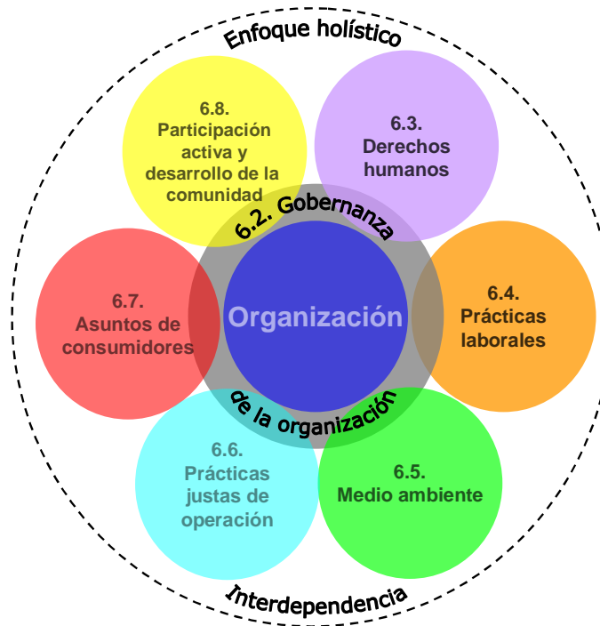
Figura 3 — Las siete materias fundamentales

Una organización puede obtener algunos beneficios importantes al abordar estas materias fundamentales y asuntos e integrar la responsabilidad social en sus decisiones y actividades (véase el recuadro 5).