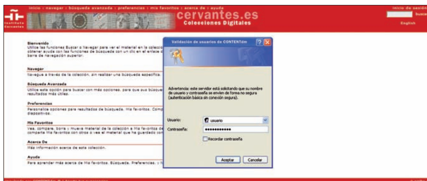
Pantalla de validación en el directorio activo del Instituto Cervantes

El software adquirido para la difusión en internet de las colecciones digitales según los estándares actuales de intercambio de información, ContentDm , permite recopilar, organizar y dar acceso web a los documentos digitales.