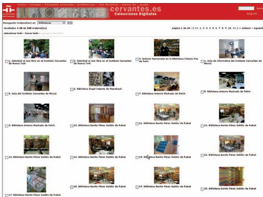
Navegación en la colección

Se ha presentado una doble necesidad en la gestión de las imágenes en el IC: la pública y la corporativa