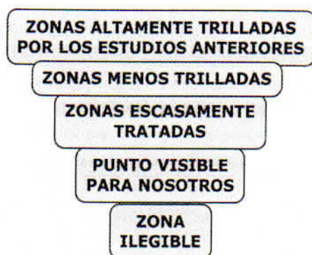
Gráfico 11: Zonas de asedio a un objeto de estudio. Elaboración propia.

No es suficiente constatar que se haya dicho algo sobre el objeto de estudio escogido para nuestra investigación. Es necesario examinar qué tan profundos, qué tan acertados, qué tan coherentes son esos resultados. Es probable que en ese examen encontremos algún punto que pueda ser cuestionado y del cual se pueda levantar una propuesta de estudio o un problema específico. A la hora de examinar los conocimientos que se tienen sobre el objeto también podemos darnos cuenta de que existen zonas muy abordadas, zonas menos frecuentadas y zonas que han quedado intactas en un objeto de estudio. Tal vez en esas zonas poco exploradas demos con un punto titilante que llame nuestra atención y del cual podamos extraer una propuesta de investigación. Ese punto visible para nosotros es probable que nadie más haya reparado en él y se convierta en la zona que nos propongamos analizar en una futura investigación 30 . Esos diferentes grados de asedio y profundización de un objeto los representamos en el Gráfico 11.