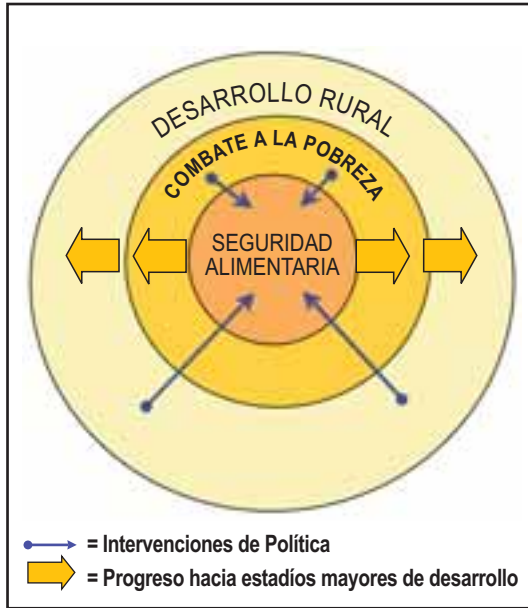
Figura 2. Seguridad Alimentaria, Pobreza y Desarrollo Rural