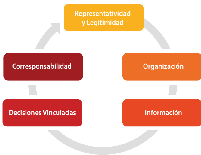
Grafico 2: Principios para la participación (Cabrera 2014)

Cada proceso participativo tiene características específicas y únicas. No existen recetas que puedan ser aplicadas a todos los casos con iguales resultados. Sin embargo, sí existen algunos principios de trabajo que deben ser tomados en cuenta para la implementación de un proceso participativo: