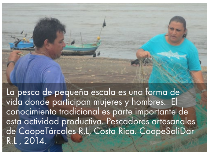
La pesca de pequeña escala es una forma de vida donde participan mujeres y hombres. El conocimiento tradicional es parte importante de esta actividad productiva. Pescadores artesanales de CoopeTárcoles R.L, Costa Rica. CoopeSoliDar R.L, 2014.