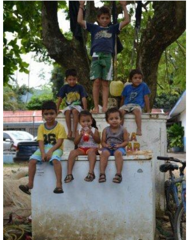
El futuro de la conservación está en las comunidades, la distribución de beneficios justa y equitativa permite mejores condiciones de vida y bienestar para todos!.

“Un grupo de aldeanos conversan sentados alrededor de una fogata. Hombres y mujeres vestidos con elegantes uniformes toman notas mientras siguen una presentación de PowerPoint. Una reunión en la sala de juntas de una compañía aborda el siguiente punto de la agenda. Estas imágenes describen diversos eventos de diaria ocurrencia en el proceso de gobernar las áreas protegidas, sean estas un parque adicional, un humedal o una reserva natural. En las últimas décadas, no solamente se ha