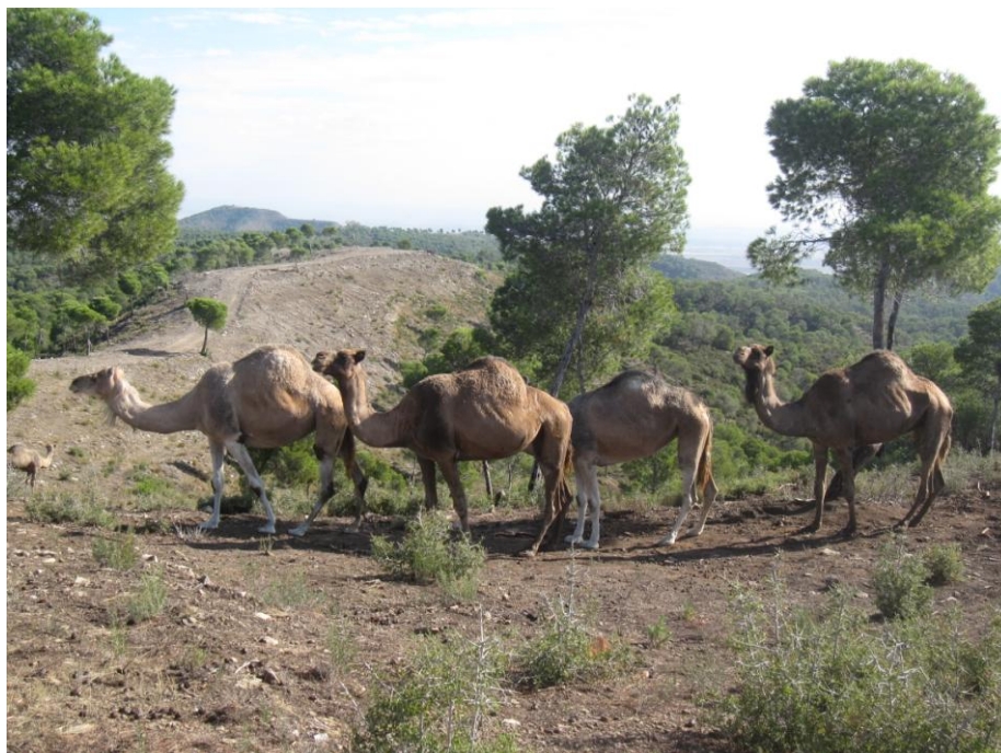
La calidad del proceso de planificación no garantiza necesariamente la calidad del producto final. Pastoreo de conservación en Zaragoza.