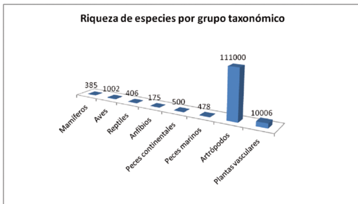
Figura 2. Número de especies por taxón de Argentina: mamíferos, aves, anfibios, reptiles, peces marino, artrópodos y plantas vasculares.

Habitan en la Argentina 385 especies de mamíferos (Ojeda et al. 2012); 1.002 especies de aves (López Lanús et al. 2008); 175 especies de anfibios (Vaira et al. 2012); 256 especies de lagartijas y anfibisbenas (Abdala et al. 2012); 136 especies de serpientes (Giraudó et al. 2012) y 14 especies de tortugas (Prado et al. 2012) (Figura 2). Dentro del grupo de los invertebrados, se estima que existen en el país alrededor de 111.000 especies de artrópodos (Claps et al. 2008).