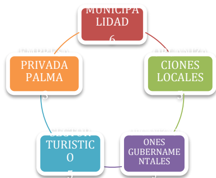
Ilustración 1. Distribución de los Actores del Turismo en el Municipio de Sayaxché

En el municipio de Sayaxché se han identificado 24 actores vinculados directamente al turismo, los cuales conforman cinco grupos de interés de la siguiente manera: