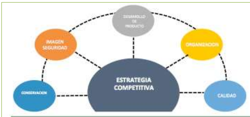
Ilustración 4. Elementos clave de la competitividad turística de Sayaxché

Desarrollar Sayaxché como un centro de servicios turísticos sostenible y reconocido que brinda experiencias de calidad en sitios emblemáticos del suroeste de Sayaxché promoviendo Ceibal, Aguateca, el Pucté.