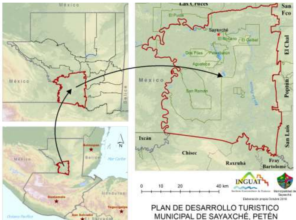
Mapa 1. Ubicación de Sayaxché, Petén

Posee abundantes recursos naturales integrados en las cuencas de los ríos Usumacinta, La Pasión y Salinas, que a su vez forman importantes ecosistemas de humedales entre las que destacan la Laguna Petexbatún, San Juan Acul, La Sombra y Las Pozas; riachuelos y arroyos como Aguateca, Cantemó, Pucté, Comixtún y Yaxtunilá; lo cual sumado a las áreas de bosque que aún quedan en el municipio le otorgan una belleza escénica con gran potencial para la atracción de visitantes.