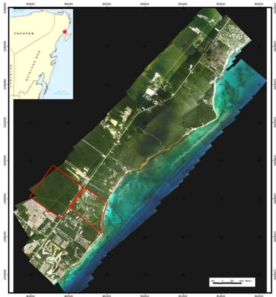
Figura 1. Ubicación del Desarrollo Turístico Mayakoba.

Mayakoba tiene una superficie de 649.7 ha y se ubica en la zona costera central del Caribe Mexicano donde existen ecosistemas de gran valor ecológico, como es el caso de la selva, manglares, duna, playa y arrecifes (Figura 1).