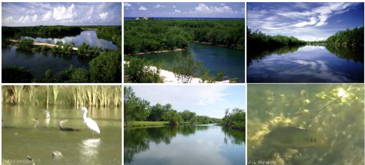
Figura 6. Condición ambiental actual del manglar y sistema de canales del Desarrollo Turístico Mayakoba.

LA IMPLEMENTACIÓN DEL SISTEMA DE CANALES DE MAYAKOBA, HA INDUCIDO LA PRESERVACIÓN Y MEJORA ESTRUCTURAL Y FUNCIONAL DEL MANGLAR, ASÍ COMO LA GENERACIÓN DE ESCENARIOS ACUÁTICOS NATURALES PERDURABLES DE ALTA CALIDAD AMBIENTAL, CON FUNCIONAMIENTO NATURAL DENTRO DE LOS LOTES HOTELEROS QUE CONFORMAN IMPORTANTES HÁBITATS ACUÁTICOS PARA AVES, PECES, CRUSTÁCEOS, MOLUSCOS Y REPTILES, PRINCIPALMENTE.