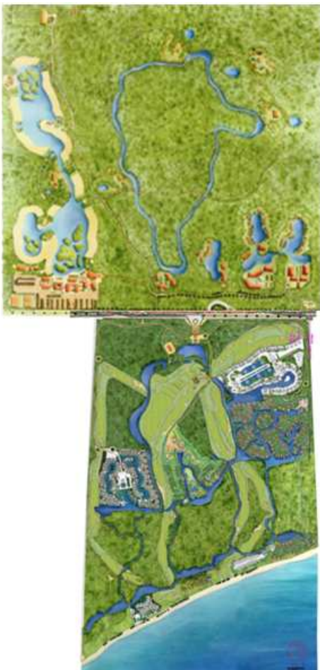
Figura 2. Componentes del Desarrollo Turístico Mayakoba.

Los objetivos principales de esta fase, fueron definir con precisión: a) los tipos de vegetación existentes y su estado de conservación, b) los tipos de ecosistemas y grado de conservación, c) los impactos ambientales de los ecosistemas y vegetación existentes en el terreno, d) las restricciones ambientales, legales y zonas de riesgo del predio y zona marina, e) las áreas convenientes para la ubicación y construcción de la infraestructura turística planteada, f) la definición de áreas que fueron incorporadas al proyecto como zonas de conservación, g) la definición de criterios ambientales, técnicos y normativos, que orientaron al grupo arquitectónico y OHL en el diseño del proyecto. El producto final de esta etapa fue la elaboración del estudio de impacto ambiental del Proyecto Mayakoba, que fue autorizado por la Secretaría de Medio Ambiente y Recursos Naturales en el año 1998. El proyecto autorizado, se compone de dos zonas turísticas, que en conjunto contemplan la construcción de 6,924 cuartos distribuidos en 13 hoteles, un campo de golf de 18 hoyos de campeonato, áreas recreativas, clubes de playa, sistemas de canales y lagos con embarcaderos, así como desarrollos inmobiliarios (Figura 2). En la Figura 3 se muestra el proceso de diseño y ajuste del proyecto hasta su versión final.