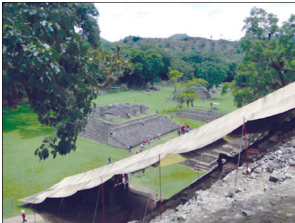
Ilustración 1 GRUPO PRINCIPAL: GRAN PLAZA DESDE LA CIMA DE LA ACRÓPOLIS

poder en el año 426 d.C. El máximo apogeo constructivo y artístico data del reinado de Uaxaklahun Ubah K'awi - 18 Conejo (695-738 d.C.), uno de los gobernantes registrados en el célebre Altar Q. Dentro del perímetro urbano, el núcleo de mayor densidad arquitectónica y monumental corresponde al área conocida como Grupo Principal, centro ceremonial y lugar de residencia de las élites regionales. Anexos al Grupo se situaban tres grandes áreas residenciales: El Cementerio, Las Sepulturas y El Bosque. Río Amarillo (a 20 km al este de Copán) funcionaba como un centro secundario, un nodo dentro del circuito de comunicación formado entre Copán y Quirigua (en el Valle del Río Motagua, actualmente Guatemala).