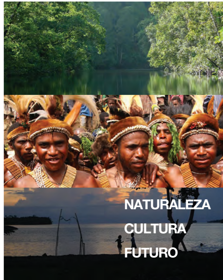
Fotografías portada: Isla Lombok, Indonesia

Para mayor información: www.iucn.org/greenlist | greenlist@iucn.org | #IUCNgreenlist